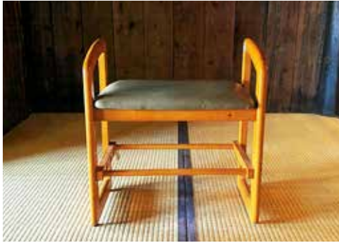
【前舟・後舟以外の席】