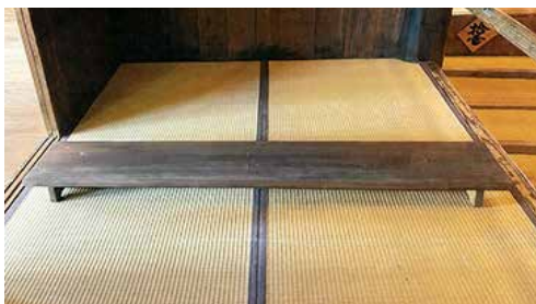
【高さ約11cmの長椅子席】