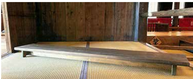
【高さ約11cmの長椅子席】