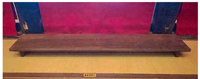
【高さ約11cmの長椅子席】